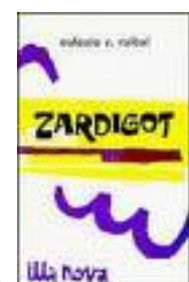
Portada do libro