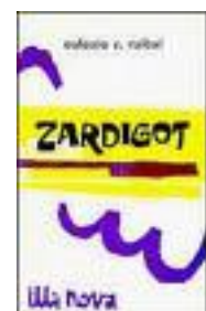
Portada do libro