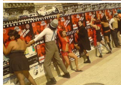
La Imagina Machina, Os Quinquilláns e Femme Fatale